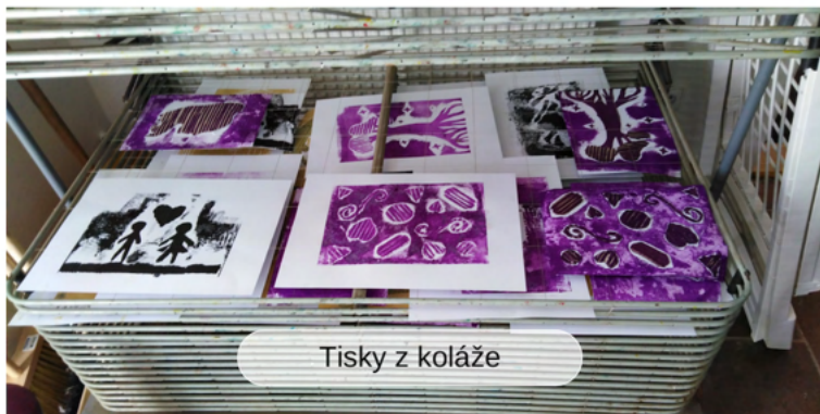
Tisky z koláže